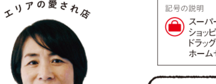
ichī-café (イチカフェ) 2011年開業の自然派カフェ。地域の憩いのスポットであり、自然食の料理教室や、器・雑貨などの企画展も開催している。

Favorite spot おかでんミュージアム + 水戸岡鋭治デザイン工場 工場の一角をリノベーションした施設。路面電車「MOMO」の模型展示やプラレール、木のプールなどがある。